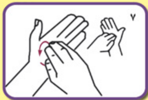
پشت و کف انگشتان دست راست را به صورت چرخشی در کف دست چپ بمالید، این عمل با دست دیگر نیز انجام شود