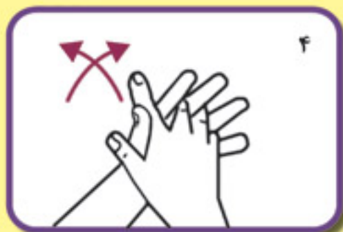
کف دست‌ها و بین انگشتان را به هم بمالید