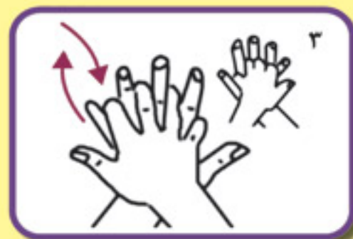
کف دست راست را به پشت دست چپ و لای انگشتان بمالید، این عمل با دست دیگر نیز انجام شود