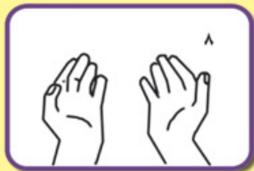
صبر کنید دست‌ها خشک شوند، دست شما تمیز است