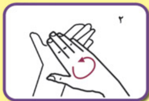
کف دست‌ها را به هم بمالید