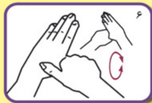
شست دست چپ را به صورت چرخشی توسط کف دست راست بمالید، این عمل با دست دیگر نیز انجام شود